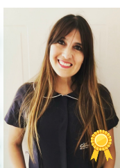
Profesor destacado mes de Julio