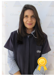
Valor del Orden