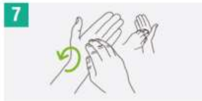
7 Frotar de manera rotacional, en ambos sentidos, con los dedos juntos y la mano derecha en la palma izquierda y viceversa