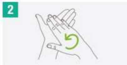
2 Frotar las manos palma con palma