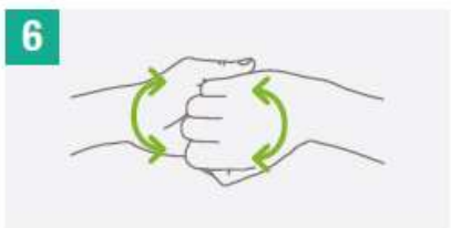
6 Frota el dorso de los dedos de una mano con la palma de la mano opuesta, agarrándose los dedos