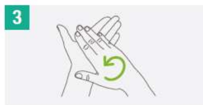
3 Frota las palmas de las manos entre sí