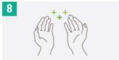
8 Una vez secas, las manos están desinfectadas