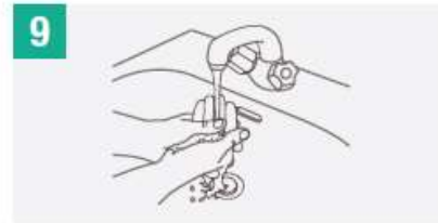
9 Enjuágate las manos con agua