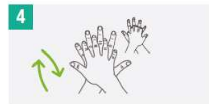
4 Frota la palma de la mano derecha contra el dorso de la mano izquierda entrelazando los dedos y viceversa