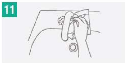
11 Utiliza la toalla para cerrar la llave