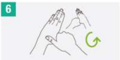
6 Frotar rotacionalmente el pulgar izquierdo en la palma derecha y viceversa