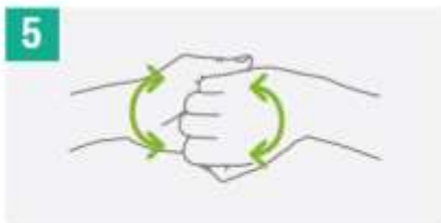
5 Frotar parte posterior de los dedos a la palma opuesta con los dedos entrelazados