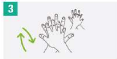
3 Frotar palma derecha sobre dorso izquierdo con dedos entrelazados y viceversa