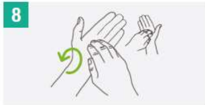
8 Frota la punta de los dedos de la mano derecha contra la palma de la mano izquierda, haciendo un movimiento de rotación y viceversa