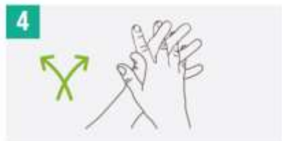
4 Frotar palma con palma con dedos entrelazados