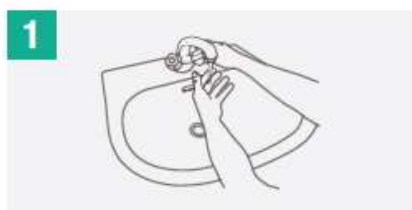
1 Mójate las manos con agua