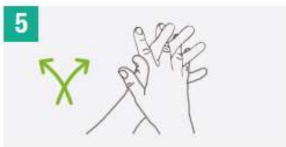
5 Frota las palmas de las manos entre sí, con los dedos entrelazados