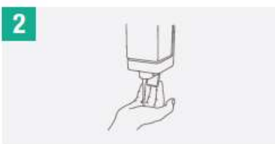
2 Deposita en la palma de la mano una cantidad de jabón suficiente para cubrir todas las superficies de las manos