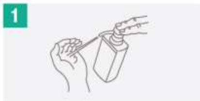
1 Aplicar una porción generosa en la mano formando un hueco para cubrir la mayor área posible