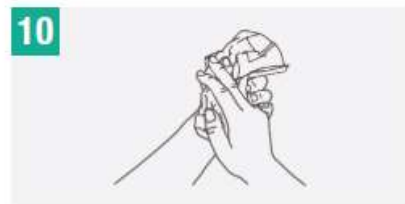
10 Secate con una toalla desechable