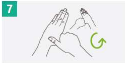
7 Frota con un movimiento de rotación el pulgar izquierdo, atrapándolo con la palma de la mano derecha y viceversa