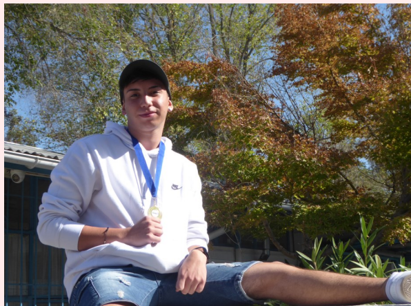
CAMPEÓN COMUNAL DE TENIS DE MESA